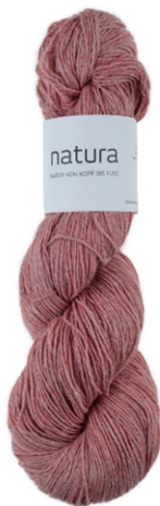
2404 peach fuzz