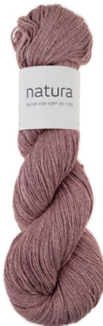
2405 sun kissed